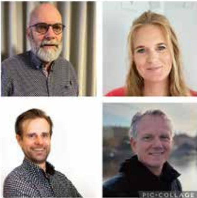
De PGH-brede beroepscommissie

roepingscommissie precies en hoe werkt het. Ikzelf had hier geen idee van toen ik in de beroepscommissie stapte. Het lijkt zo makkelijk, je zet een vacature uit en er komen sollicitanten, toch?