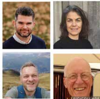
De PGH-brede beroepingscommissie

Dat u soms een tijdje niks van ons hoort, betekent zeker niet dat wij de afgelopen tijd stilgezeten hebben. Wij kunnen inhoudelijk nog niet te veel vertellen, maar we kunnen in elk geval wel vertellen waar wij op dit moment mee bezig zijn. In ons vorige bericht heeft u al het een en ander kunnen lezen over het aantal namen dat wij onderzocht hebben, via welke kanalen wij die verkregen hebben en hoe ver het daarmee stond. Deze keer wil ik u meenemen in het proces. Wat doet een be-