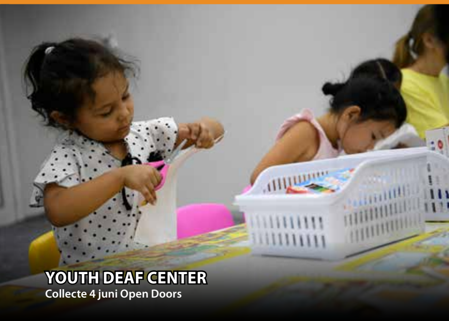
YOUTH DEAF CENTER Collecte 4 juni Open Doors

Dove vervolgd christenen hebben uw hulp nodig. In landen als Oezbekistan, Kazachstan, Turkmenistan en Kirgizië zijn doven de snelst groeiende gemeenschap. Doof zijn wordt daar als een handicap en schande gezien. Daardoor krijgen doven geen enkele hulp van de overheid en van de gemeenschappen om hen heen. En als een doof iemand christen wordt, wordt deze persoon ook nog eens verstoten uit het dorp.