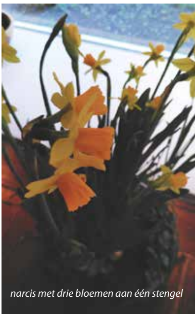
narcis met drie bloemen aan één stengel