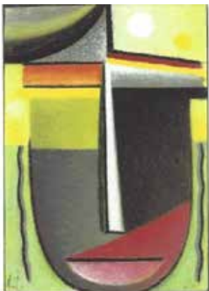
Christelijke mystiek in woord en beeld