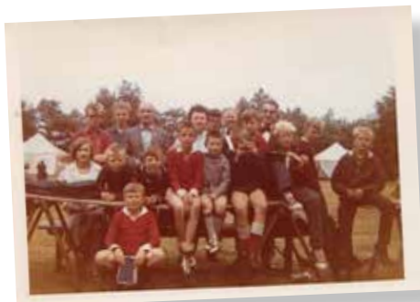
kamp heel vroeger

De komleiding van het PGH-jeugdkamp op 13 - 15 mei zou het leuk vinden indien 'ouderen' uit de gemeente (individueel- of samen met uw werkgroep, stichting, of commissie) een dagdeel willen deelnemen aan het kamp voor kerkjongeren in de leeftijd van het voortgezet onderwijs. Het kamp is in Vierhouten. Uw aandeel: kies uit deelnemen aan spelletjes, meehelpen kokkerellen, aanwezig zijn bij de overdenking, het bijwonen van een bonte avond en gesprekken voeren met jongeren etc. Het programma voor deze dagen is perfect, uitdagend maar voor een ieder heel goed te doen. Uit ervaring weten we dat jongeren geïnteresseerd zijn in de belevingswereld van ouderen. 'Hoe ging- en was het vroeger?' Een weekend bomvol activiteiten, waarin toenadering wordt gezocht met overige gemeenteleden.