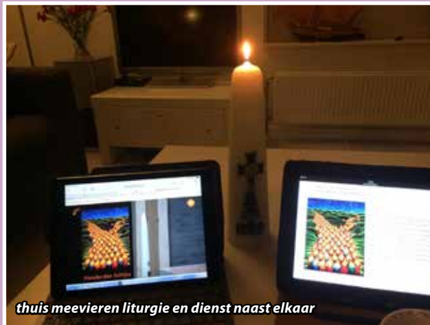
thuis meevieren liturgie en dienst naast elkaar