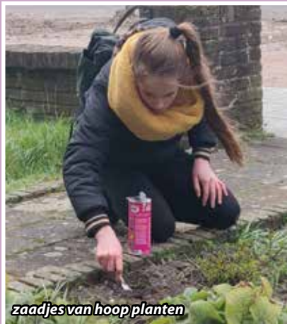
zaadjes van hoop planten