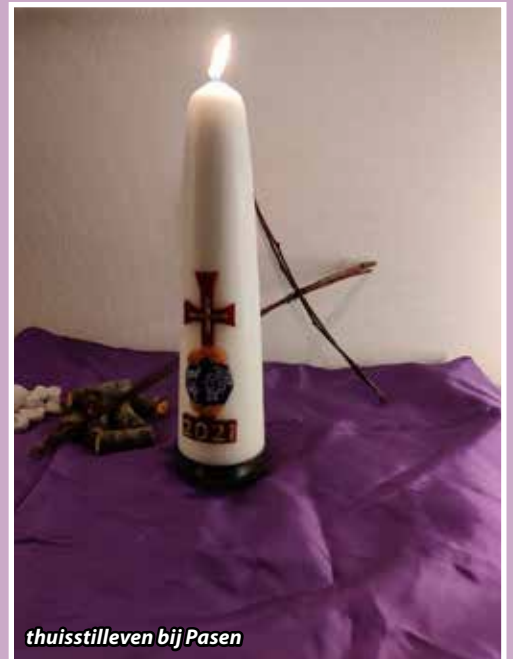
thuisstillven bij Pasen