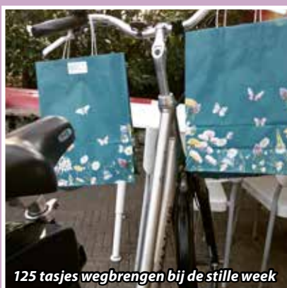
125 tasjes wegbrengen bij de stille week