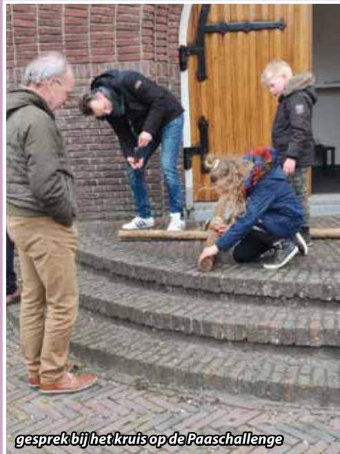
gesprek bij het kruis op de Paaschallenge