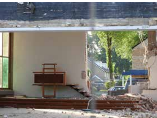
Stadsdennenkerk onder de slopershamer

genoemd werd. Een plaats waar veel lief en leed gedeeld werd. Een plaats waar omheen een aura hangt van mystieke ervaring en geloofsbeleving - waar je getrouwd bent, je kind liet dopen, je geliefde hebt