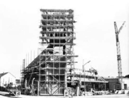
Stadsdennenkerk toen in aanbouw

In maart 1969 werd de Stadsdennenkerk in gebruik genomen. Nu vijftig jaar later is hij afgebroken. Bijna vijftig jaar is de kerk een zichtbaar teken geweest van Gods heilspresentie in de wijk. Een vindplaats van heil voor velen uit de stadswijk waarnaar hij