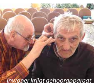
inwoner krijgt gehoorapparaat